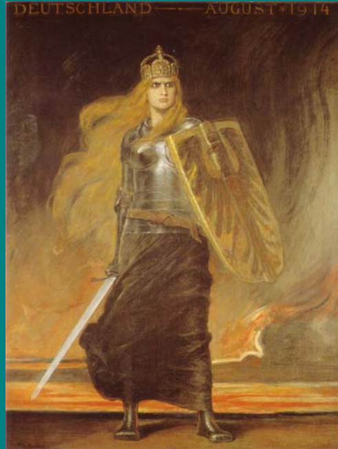
Germania par Friedrich August Von Kaulbach - 1914