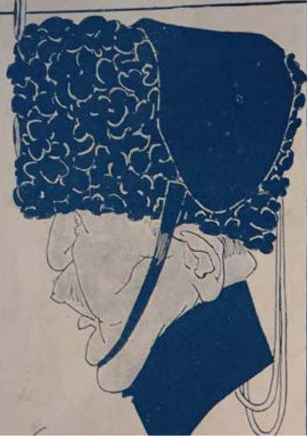
Prince Eitel de Prusse