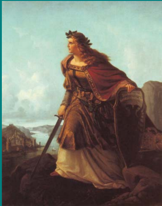
Germania montant la garde sur le Rhin par Lorenz Clasen – 1860