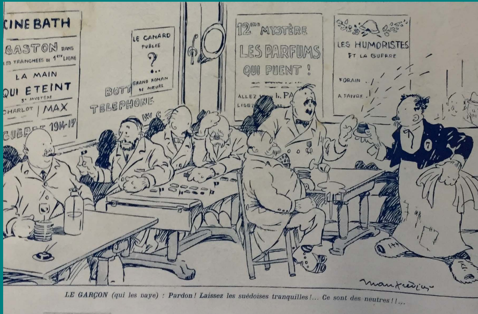
Enzo Manfrédini – LE GARÇON (qui les paye) : Pardon laissez les suédoises tranquilles ! Se sont des neutres !!... Le pays de France, 22 juin 1916