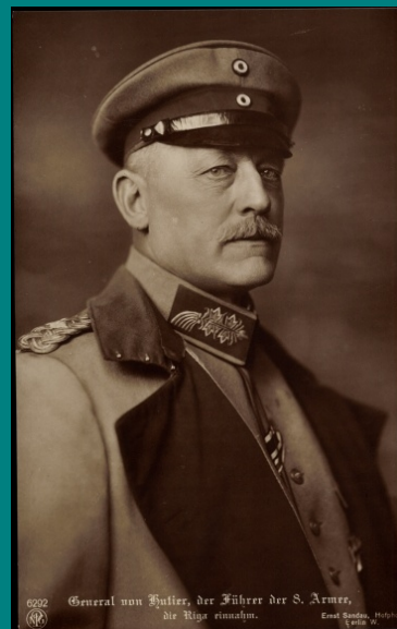
6202 General von Huttier, der Führer der 8. Armee, die Riga einnahm.